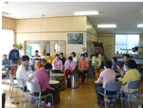
知的障害者施設K様 月例ドラムサークル