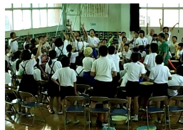
2013年10月 薩摩川内市立市比野小学校