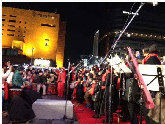
2013年12月 博多駅ミュージックリボンドラムサークル