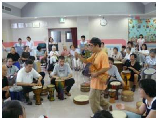
S病院様／認知症・統合失調症 作業療法ドラムサークル(月例実施)