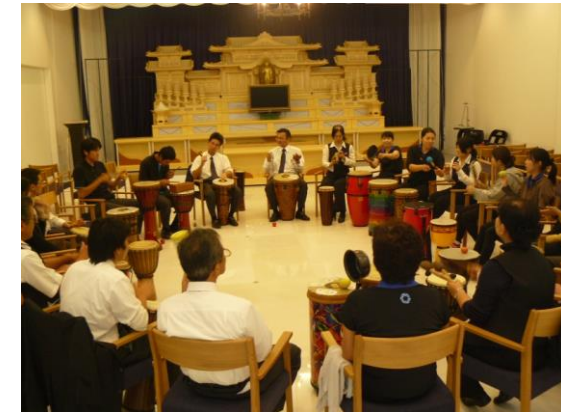
2010年10月天国葬祭様社員研修