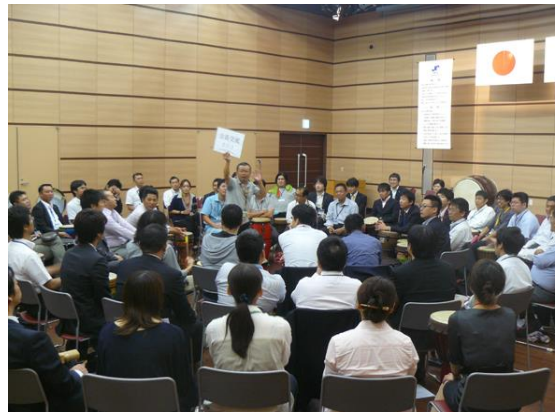
2013年10月下関商工会議所青年部様 例会研修ドラムサークル