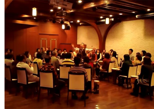
2014年1月 株式会社丸八様 ニューイヤーキックオフ研修