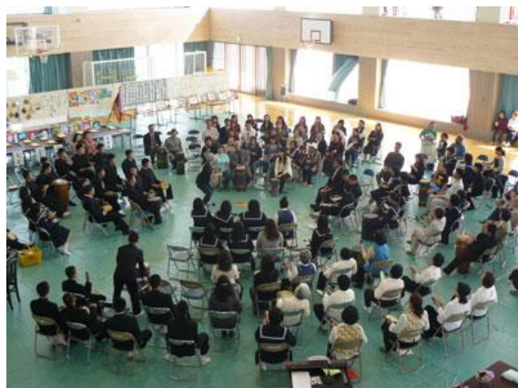
2012年2月12日(文化庁派遣事業) 沖縄県宮古島市立西辺中学校 第10回たまうつ音楽祭ドラムサークル