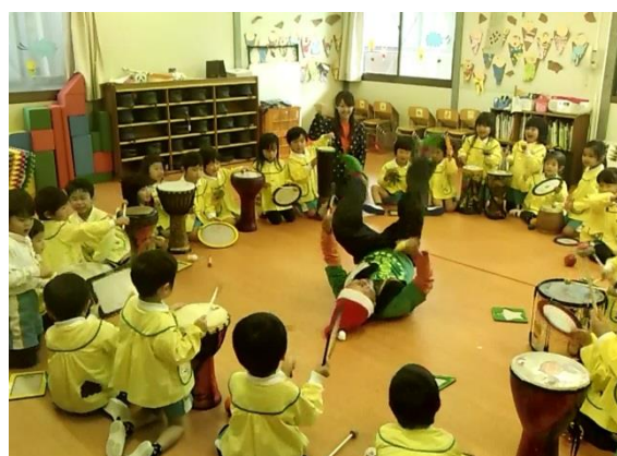
2013年12月 鴨池しらうめ幼稚園