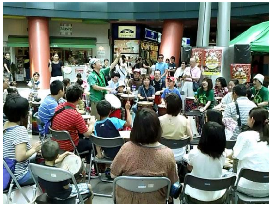
2013年7月7日(日) ドラムストラック福岡公演記念 ドラムサークル@キャナルシティ