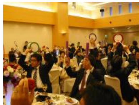
T家・H家結婚披露宴 ブライダルドラムサークル