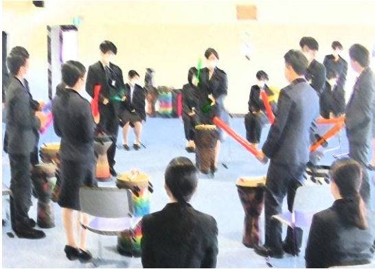
2021年4月実施 新入行員研修 南日本銀行 様 2020年、2022年、コロナ禍中止