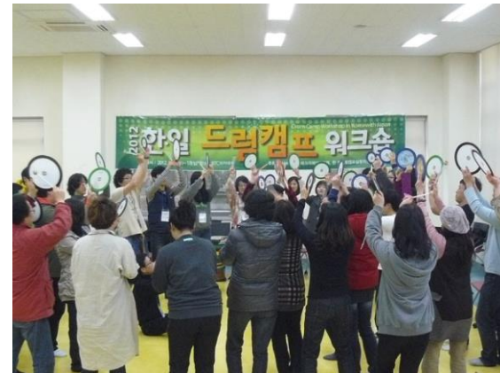
2012年3月17日(土)～18日(日) 韓日親善ドラムキャンプin釜山