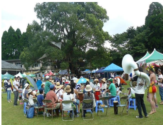
2014年～毎年 グッドネイバースジャンボリー@ 川辺森の学校