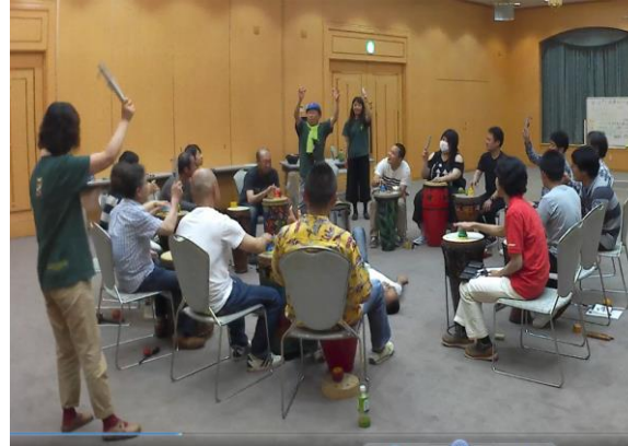
2017年5月 ワタキ自動車株式会社様(兵庫県) 桜島社員旅行研修