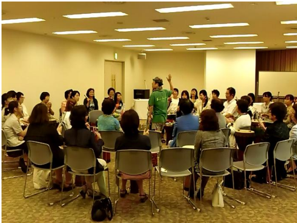
2014年8月 鹿児島県中小企業団体中央会様 女性部会研修ドラムサークル