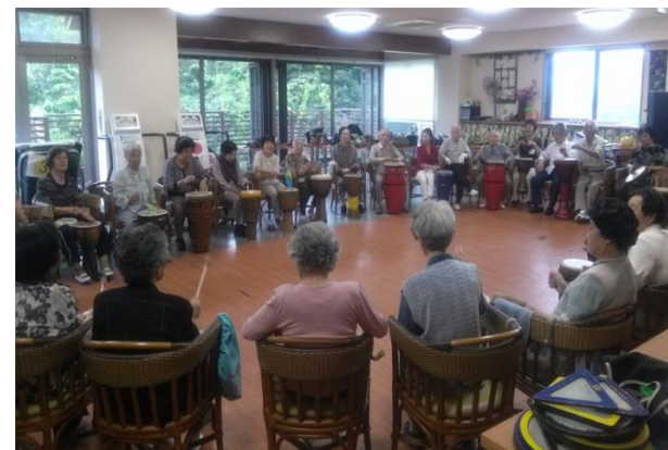
デイサービスセンターM様(毎月実施) (対象:高齢者)